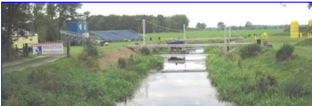
De voorbereidingen van Operatie Grensland aan de Hearsterwei-Skieding zijn al weken van tevoren gestart

Een week lang is Frieschepalen in de ban van de locatievoorstelling Operatie Grensland. Het Friese theatergezelschap BUOG (Bedenkers en Uitvoerders van Ongewone Gebeurtenissen) en de Stichting Peerd uit Groningen hebben op de Fries-Groningse grens, bij grenspaal 14, een schitterende en professionele theaterproductie in de open lucht neergezet, waarin de sentimenten en ruzies tussen Friezen en Groningers flink oplaaien.