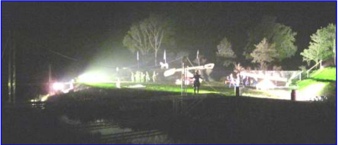
Scène uit de gevechten om de loopgraven

of stoot het verdrag over de grens getekend.