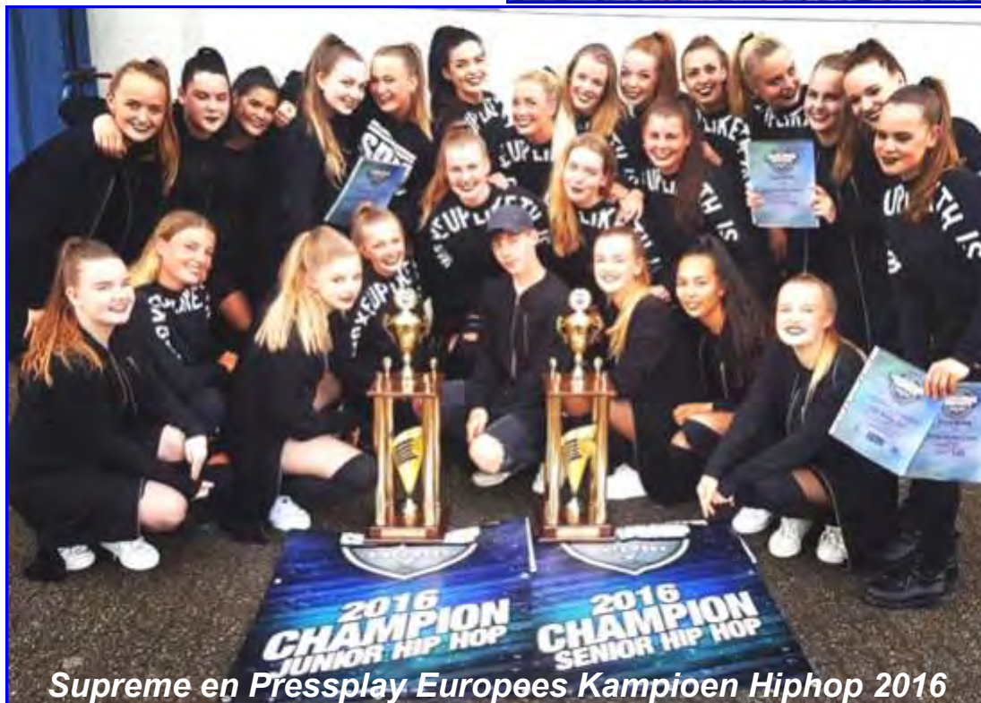
Supreme en Pressplay Europees Kampioen Hiphop 2016