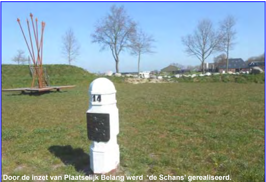
Door de inzet van Plaatselijk Belang werd 'de Schans' gerealiseerd.