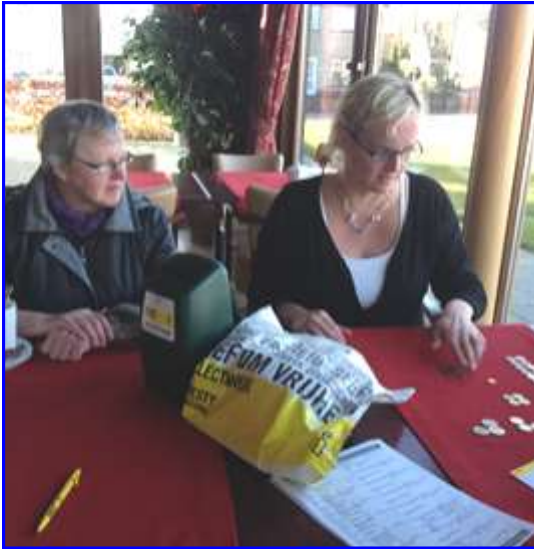
Tellen van de opbrengst van de Amnesty collecte 2015

(Bakkeveen: €470; Ureterp: €380; Wijnjewoude: €114; Siegerswoude: €330). Amnesty dankt iedereen van harte voor de geldelijke bijdrage.