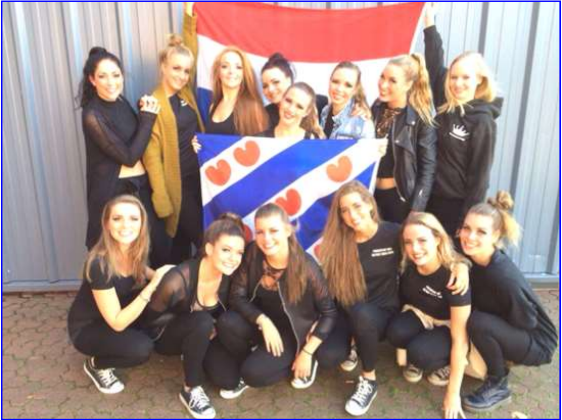
Demoteam PressPlay tydens it WK in Glasgow augustus 2014. Dit team van SDM oefent ek in De Uthof.

jins partikuliere hichte en djiptepunten stal tejaan mei famylje en kunde. Trouwfeesten, jubileums, mar ek begraffenis fine plak yn dit gebou, dat sa rêstich gelegen is en in flink parkearplak hat.