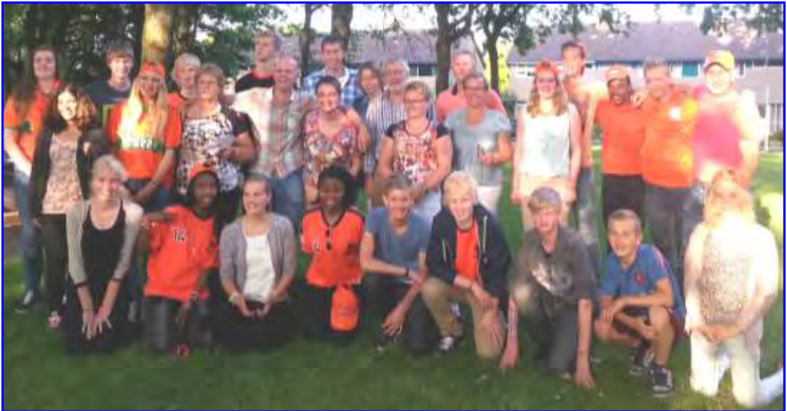
Afgelopen zomer waren enkele medewerkers en jongeren uit Kriel te gast in Frieschepalen, samen met de meeste vrijwilligers staan ze hier op de foto.