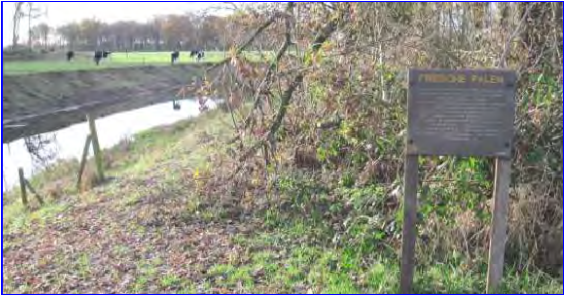
Bij de Scheiding verschijnen de contouren van de oude schans in het landschap. Plaatselijk Belang wil daar graag informatiepanelen geplaatst zien, zoals bij het kuierpad hier vlakbij, dat op initiatief van Plaatselijk Belang tot stand is gekomen.

De oude schans, een in 1593 gebouwde verdedigingslinie tegen de Spanjaarden, zal ook in het landschap opduiken bij de Scheiding, op de grens tussen de beide provincies. Door dit initiatief van Plaatselijk Belang wordt de schans, op de oorspronkelijke plaats, weer beleefbaar voor bewoners, fietsers, wandelaars en andere passanten. Ook de gemeente Marum staat er positief tegenover. Het wordt geen reconstructie van de schans, maar een verwijzing die de bezoeker duidelijk maakt dat hij op een bijzonder punt in het landschap staat. Door grondwallen wordt de schans vormgegeven, hiervoor zal een deel van de bosjes bij de 'Frieschepalenvaart' worden gekapt. De provincie Fryslân heeft al 30.000 euro toegezegd. Dijkstra verwacht dat volgend jaar kan worden begonnen. "Vrijwilligers kunnen vierhonderd uren invullen, dat levert achtduizend euro op." Dijkstra denkt dat de nieuwe schans geen toeristisch wereldwonder wordt, maar wel waardevol is voor het dorp en