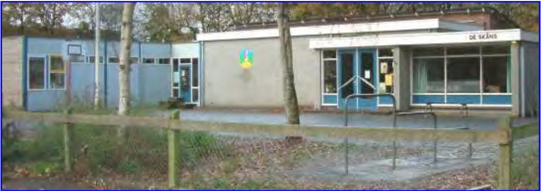
Plaatselijk Belang zet zich in voor woningbouw op de plaats waar nu nog de oude basisschool De Skâns staat.

defibrillator (aed) is een netwerk van twintig vrijwilligers actief.”